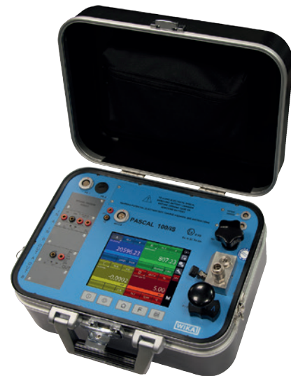
Hand-Held Multifunktionskalibrator, Typ Pascal 100