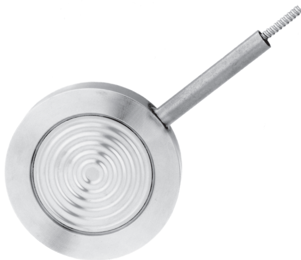
Разделитель, Фланцевое присоединение, Ячеечного типа, Модель 990.28 с капилляром