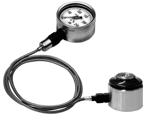
Hydraulischer Druckkraftaufnehmer, Typ F1125

Die hydraulische Kraftmessung ist eine einfache Möglichkeit, um die in verschiedenen Anwendungen auftretenden Kräfte zu erfassen und anzuzeigen. Die hydraulische Kraftmesstechnik nutzt eine Kolben-Gehäuse-Kombination mit verschiedenen Abdichtungen als Aufnehmereinheit. Die einwirkende Kraft ist das Produkt aus Fläche und Druck. Zur Kraftanzeige können Manometer, Drucksensoren oder Druckmessgeräte mit Kontakteinrichtung verwendet werden. Dabei kann die Skale des Anzeigegeräts in verschiedenen Einheiten ausgelegt werden, z. B. N, kN, kg, t.