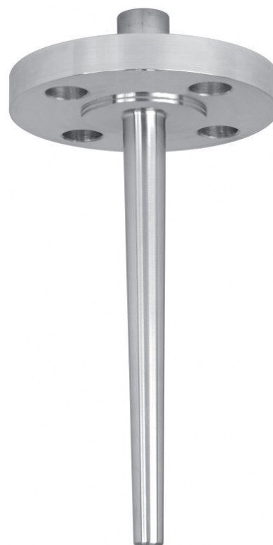
Termômetro com flange Modelo SI450F

Comprimento de inserção U 1 + comprimento da conexão T